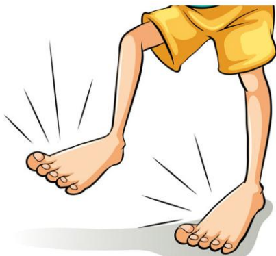
ТОН - ТОН