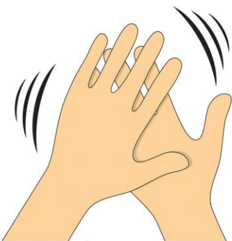
ХЛОП - ХЛОП