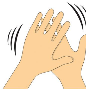
ХЛОП - ХЛОП